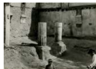
Arquivo Museu de Lisboa