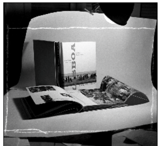
Fotografia p. 23 do livro Lisboa, "Cidade Triste e Alegre"