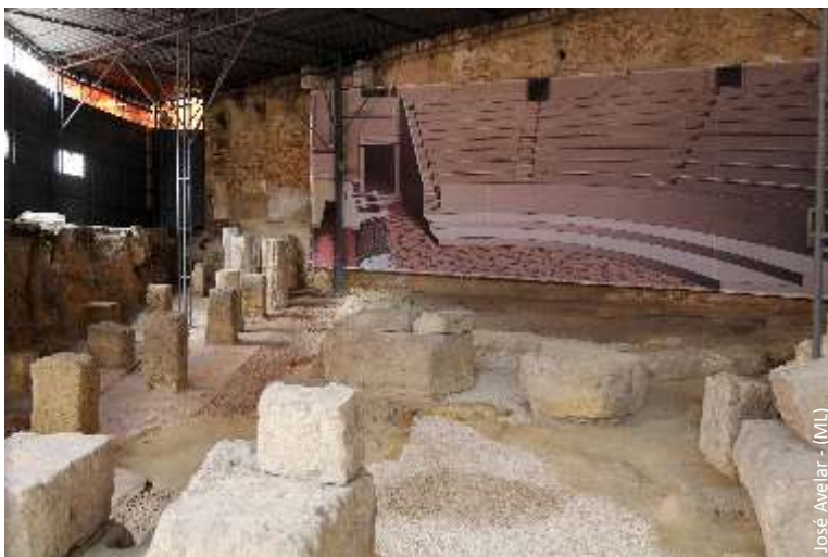
Ruína do Teatro Romano com reconstituição das Caveas

Bilhetes: 3€; Desconto 50%: Pessoas com mais de 65 anos, desempregados, Cartão-jovem; Bilhete de Família: 1€ (mínimo 3 pessoas); Entrada livre: domingos de manhã e feriados, das 10h às 14h