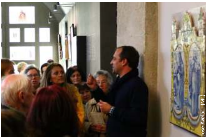
Visita orientada e concerto de Peu Madureira, fevereiro 2018

Entrance 5 € with discounts. Limited to the available seats; Reservation: servicoeducativo@museudelesboa.pt