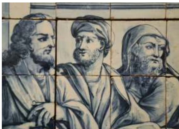
Painel de azulejos com episódios da vida de São Sebastião Nicolau de Freitas (atr.) Lisboa, c. 1740 Museu de Lisboa | MC.AZU.0051

Duração: 15h veja o programa completo aqui