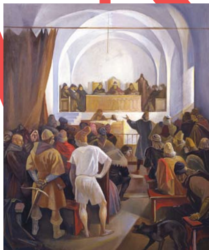
Santo António com o Menino Óleo s/ tela Joaquim Manuel da Rocha Séc. XVIII (2ª metade)