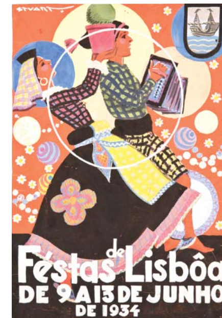
Festas de Lisboa de 9 a 13 de Junho de 1934 Guache s/ papel Stuart de Carvalhais 1934

celebrando a tradição popular do santo casamenteiro. A cidade prepara-se para a noite das Marchas Populares , desfile que desce a avenida da Liberdade e no qual competem os bairros históricos. Nessa noite, os arraiais , dispersos um pouco por toda a cidade desde o início do mês, adquirem um colorido e uma animação excecionais, com a música e a sardinha assada, os cravos, os manjericos e as flores de papel, numa festa que dura até ao amanhecer. No dia 13 de junho, feriado municipal em Lisboa, a imagem de Santo António sai da sua igreja em popular procissão que percorre o bairro de Alfama numa celebração genuína de fé e devoção. As festas que Lisboa celebra durante o mês de junho incluem também o São João, a 24, e São Pedro, a 29, que com Santo António constituem os Santos Populares .