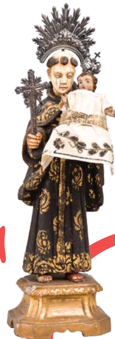
Santo António com o Menino Madeira policromada, marfim, prata e seda Autor desconhecido Séc. XVIII